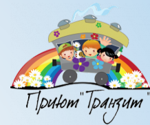
График работы: круглосуточно